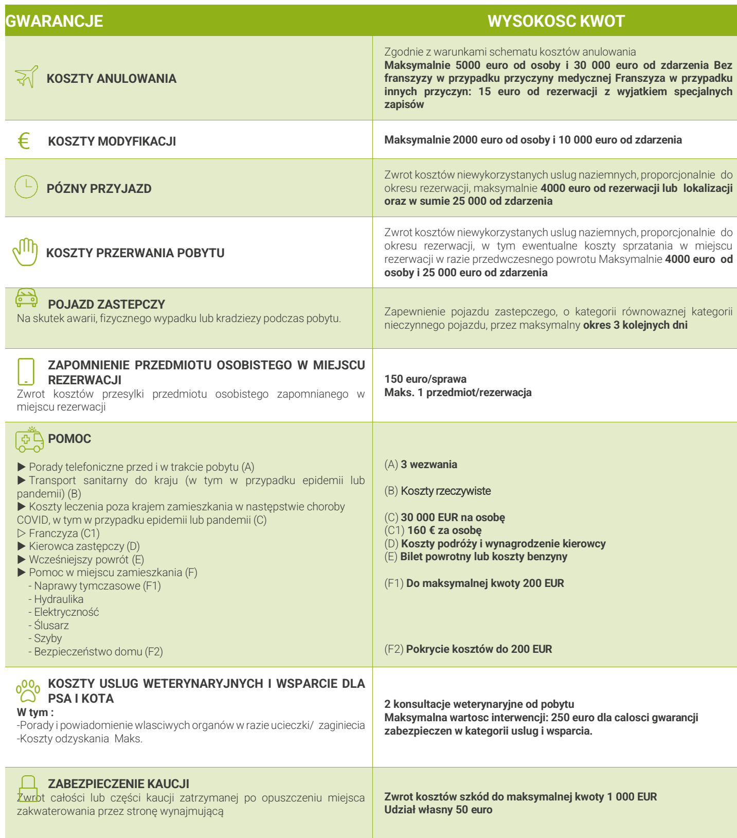
TABELA WYSOKOSCI GWARANCJI